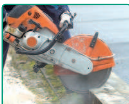
DUO GRANIT 300 mm