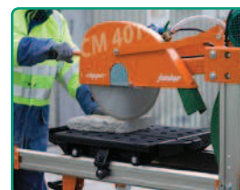
DUO GRANIT 350 mm na CM401 (strana 99)